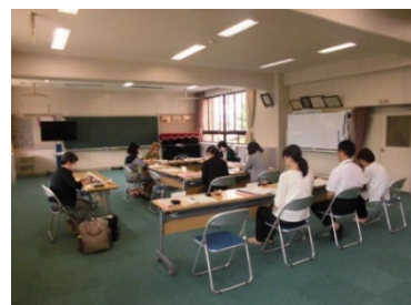
【学校運営協議会の様子】

今年度は、できることから少しずつ実現させていくために、学校に力を貸していただける保護者や地域の方々による「風の子・太陽の子応援団」を結成することから始めました。学校支援コーディネーター (CD) が連絡・調整をし、外部講師やボランティアと協力しながら進めている教育活動がたくさんあります。学校HPにも、コミュニティ・スクール情報をアップしていますので、是非ご覧ください。